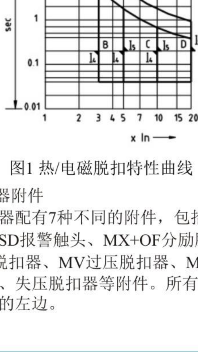
图1 热/电磁脱扣特性曲线