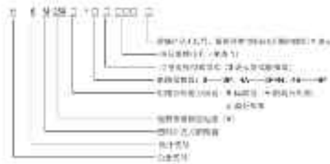
表 1 符合性声明